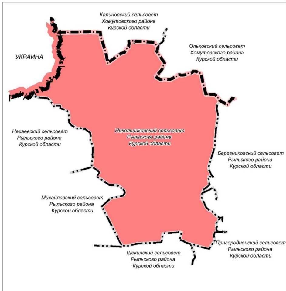
Рис. 1.1.1 Существующие границы муниципального образования «Никольниковский сельсовет» Рыльского района Курской области

Численность населения на 01.01.2022 г. составила 1012 человек.